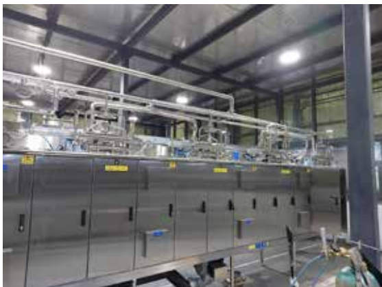
Linjan asennusta Intiasta SMC Creamy Foods Pvt.Ltd tiloissa Delhin lähellä Noidassa.

Intiassa Inflaatio on yli 20%, minkä lisäksi valtiossa on tapahtunut jonkinasteinen sotilasvallankaappaus. Intia neuvottelee IMF:n kanssa lainajärjestelystä. Vallasta syösty oppositio yrittää saada vaalit aikaan. Elecsterin kannalta positiivista on se, että keskustelukanavat kaikkien UHT-linjojen valmistajien ovat auki ja oikeaa kiinnostusta varsinkin UHT-pussituotteeseen on olemassa. Intian kansantalouden pitää kuitenkin päästä tukevasti jaloilleen ennen mahdollisten investointien alkamista.