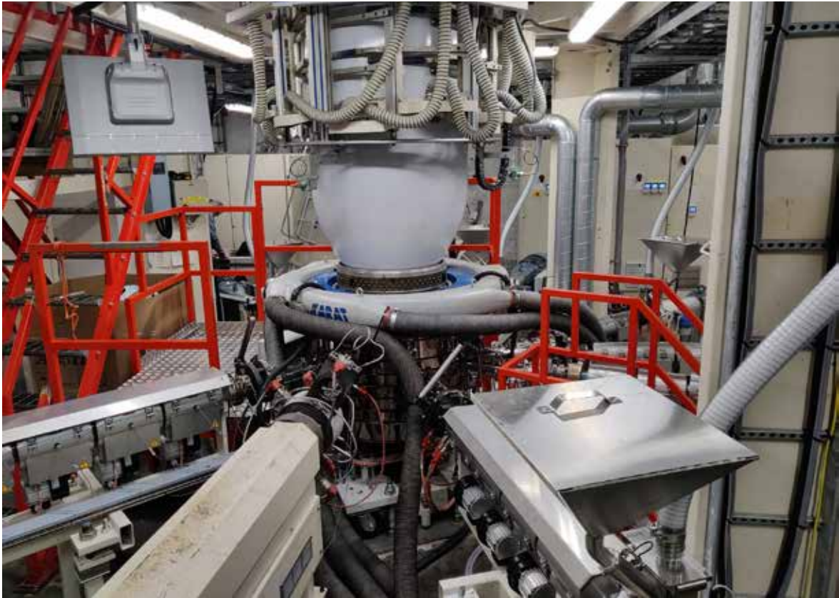
Uusi 12/9-kerroksinen ekstruuderit

IT:n osalta Elecster lähti vuoteen 2022 uuden yhteistyökumppanin kanssa, joksi valikoitui pitkien keskustelujen jälkeen suomalainen palveluntuottaja Decens Oy. Decensin kanssa solmittu yhteistyösopimus parantaa yrityksen tietoturva ja luo varmuutta yhä enemmän verkossa toimiviin toimintaympäristöihin. Myös pitkäaikainen tulostuskumppani vaihtui: uutena kumppanina on nyt Wellbit Oy, joka toimittaa Ricohin tulostimia. Ricohin laitteisiin päädyttiin, koska Ricohin tulostusympäristössä on monia hyviä tekijöitä, tärkeimpänä turvatulostusominaisuudet. Viime vuoden aikana panostimme erityisen paljon tietoturvaan, ja siihen on tarkoitus kiinnittää entistäkin enemmän huomiota tulevaisuudessa.