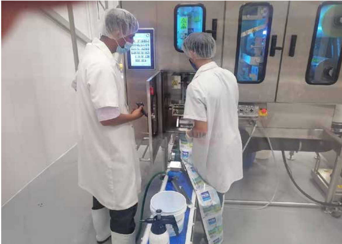
UHT-linjan käyttöönotto Belizessä vuonna 2022

na. Alkuvuonna Belizessä käyttöön otettu UHT-linjasto on maan ensimmäinen UHT-tuotteita prosessoiva laitteisto. Laitteisto on lähtenyt kivuttomasti käyntiin, mikä osoittaa Elecsterin teknisen ja muun tuen toimivaksi.